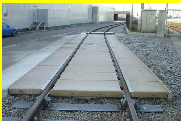
Eingleisstelle für Einsatzfahrzeuge (z.B. Feuerwehr) Österreich