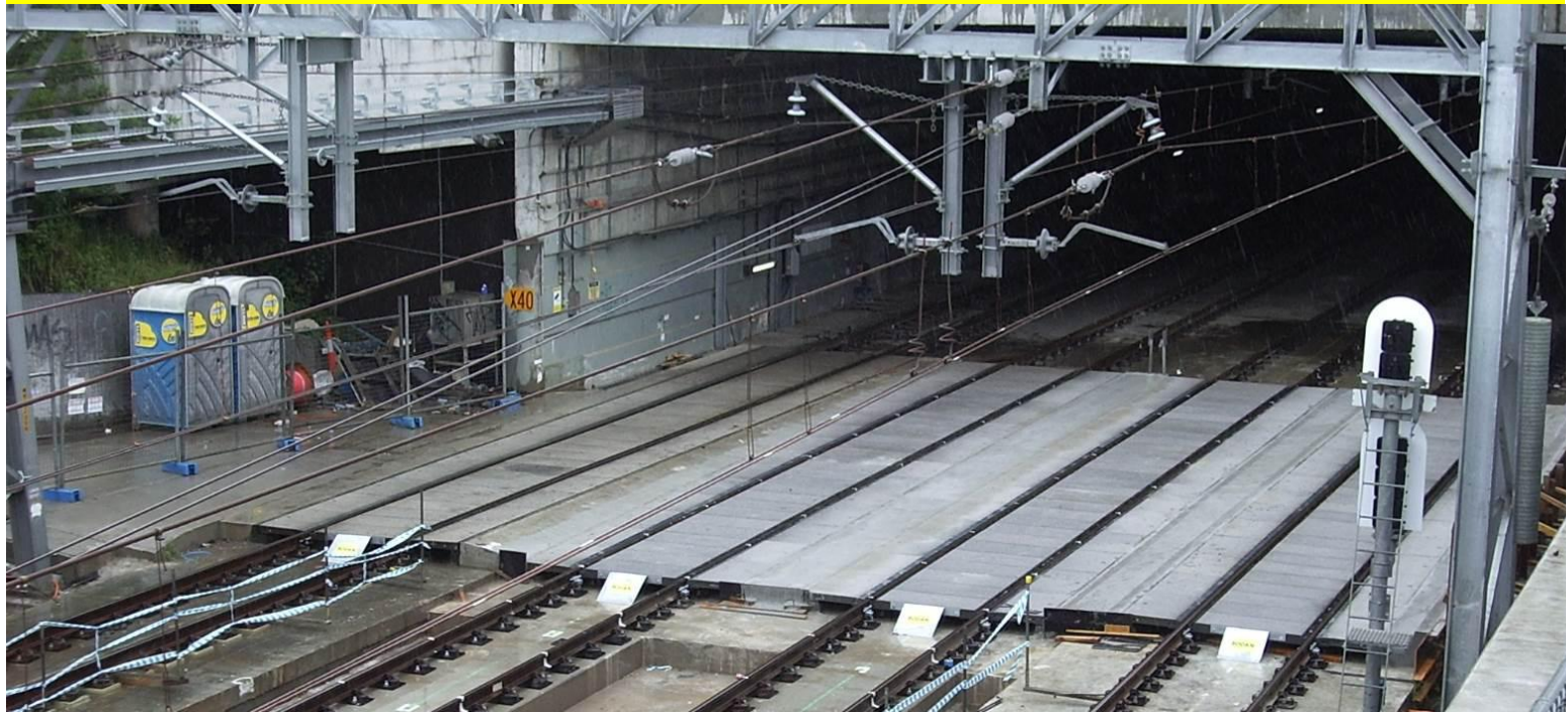
Eingleisstelle für Feuerwehrfahrzeuge bei Tunnelleinsätzen / Australien