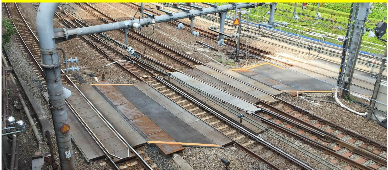
Eingleisstelle für Baustellenfahrzeuge / Japan