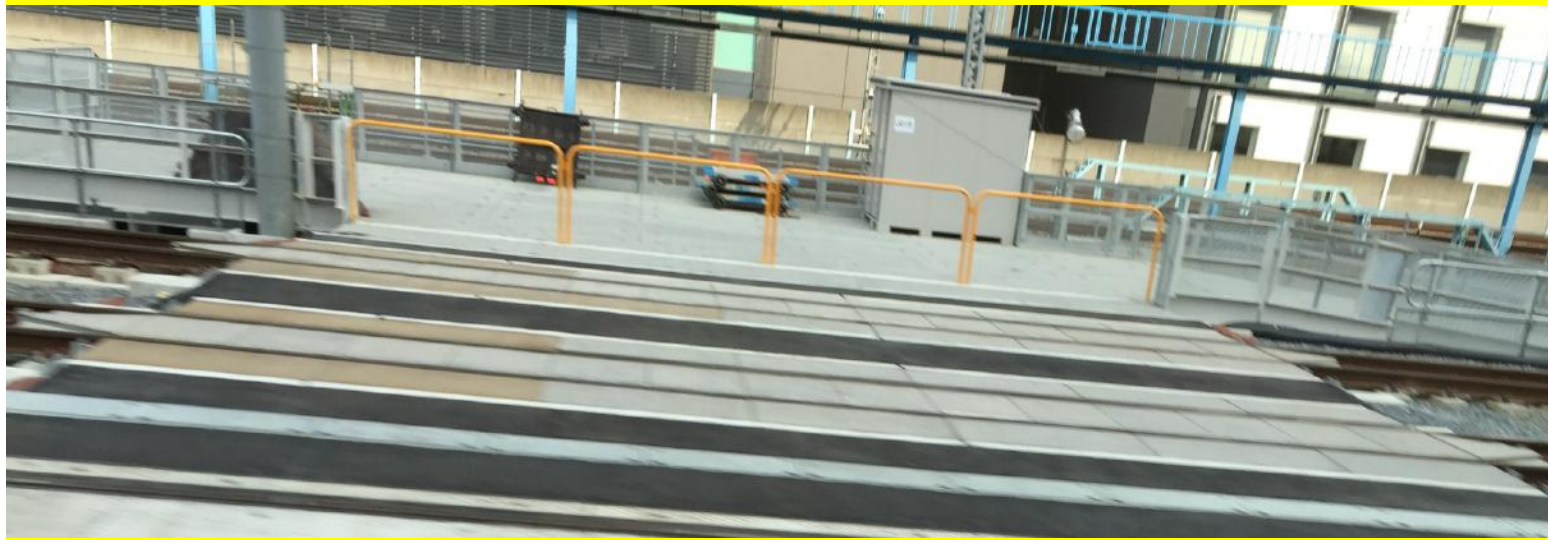
Eingleisstelle für Instandhaltungsfahrzeuge / Japan